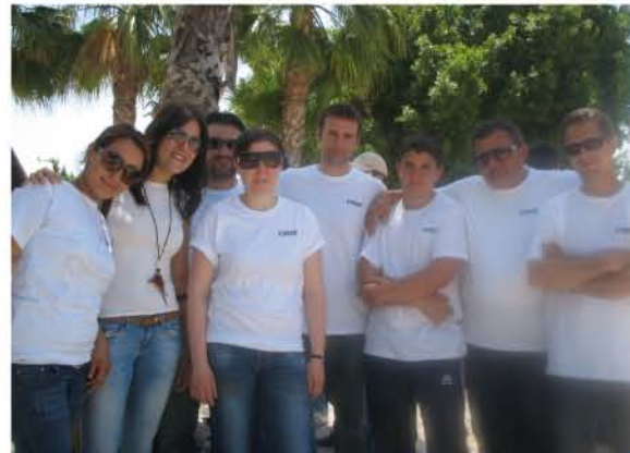
Empleados de CADE voluntarios en la acción solidaria