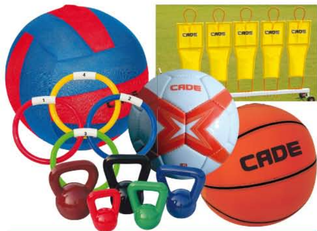
Algunos de los productos que comercializa Cadedirect