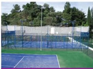
2 pistas de exterior en color azul

La pista de pádel La Jaula se puede adaptar a distintos contextos con sus múltiples opciones de configuración, en este ejemplo se muestran 6 pistas de pádel del último complejo deportivo construido por CADE en Ubrique.