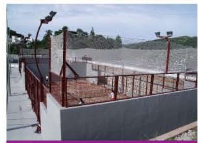
2 pistas sobre muro en color rojo