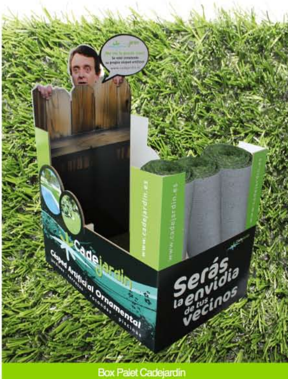
Box Palet Cadejardín

Se sirve sobre un palet europeo con 12 rollos de 1 x 5 m, dispone de dos mostradores laterales para la prueba del producto.