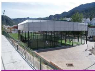
2 pistas techadas en color verde